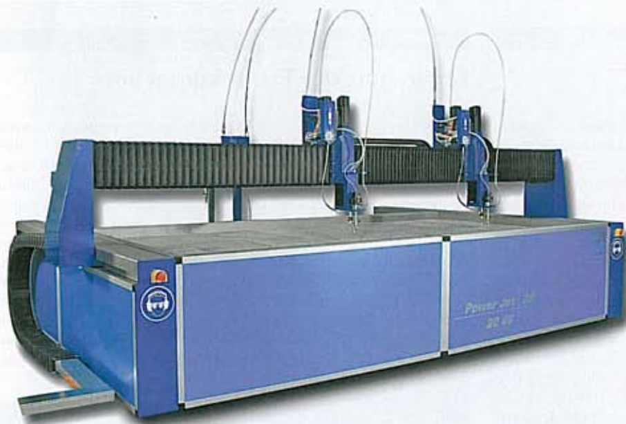
2: Der aus der Schneiddüse austretende Wassersandstrahl trifft mit hoher kinetischer Energie auf das Werkstück und trägt in Sekundenbruchteilen Materialpartikel ab.